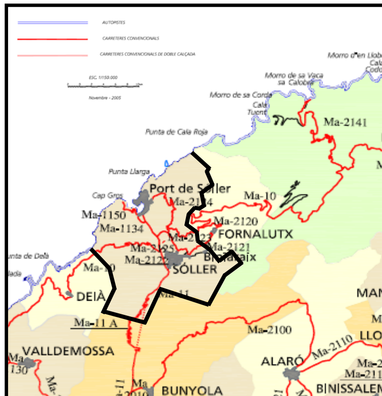
Figura 1.3.1. Mapa de les carreteres a Sóller